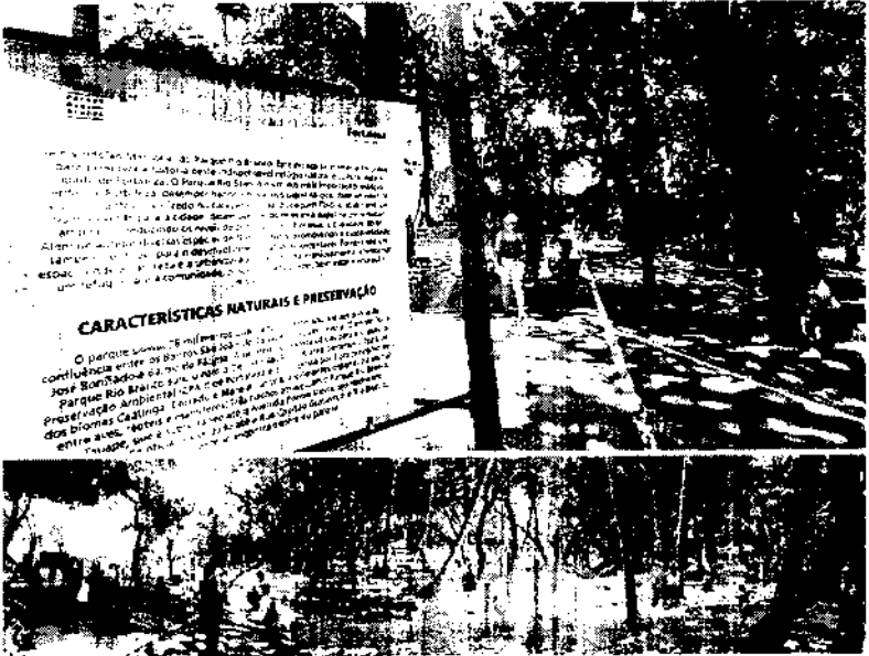
Esporte foi destaque nas duas semanas e conta com playgrounds, praças, hidrelétrico, gramíneas de arte, arenina e quadras de beach tennis

A previsão de resultado mais tristes ou negativas por causa do impacto das eleições no Rio Grande do Sul na economia não se confirmaram. Em parte devido às ações para re-aperar do estado. São esperados números positivos para indústria, construção e setor de serviços, impulsionados pelo aumento de consumo e das investimentos.