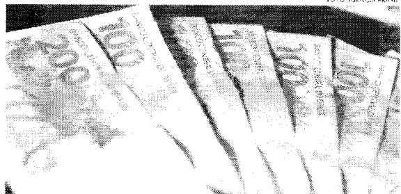
O texto também prevê mudanças na tributação sobre patrimônio, com cobrança de imposto sobre transporte de luxo e heranças

Estudo feito pelo Instituto de Pesquisa Econômica Aplicada (Ipea) identificou que 85% dos municípios brasileiros, incluindo 11 capitais, e também 17 estados vão ampliar sua fatia no bolo com essa mudança. Outros, no entanto, perdem participação no bolo, ainda assim, terão aumento de arrecadação com a reforma em termos absolutos. O Ipea calcula que apenas 16 municípios