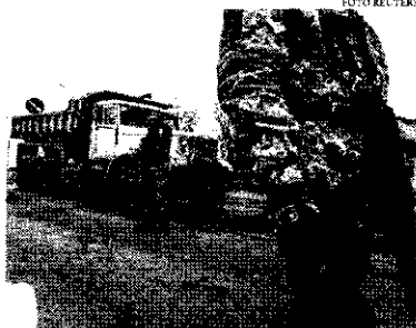
Inteligência militar de Kiev acusa Moscou de preparar "grande provocação"

O presidente da Turquia, Recep Tayyip Erdogan, afirmou nesta quinta-feira (18) que seu país está do lado da Ucrânia na guerra contra a Rússia. "Enquanto continuarmos nossos esforços para encontrar uma solução permanente ao lado de nossos amigos ucranianos", disse a declaração, que poderia soar como a repetição de outras manifestações de apoio por parte de aliados de Kiev, chama a atenção por contrastar com os passos recentes de Erdogan nos últimos meses, o turco vinha se aproximando de seu homólogo russo, Vladimir Putin.