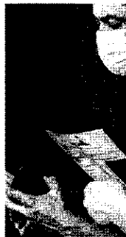
A população desocupada recuou 5,8% frente ao trimestre móvel anterior, o que representa 699 mil pessoas a menos

No mesmo toado, o rendimento médio real do trabalhador registrou recuo de 7,9% em relação ao mesmo