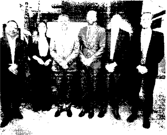
No Ceará, os pré-contratos assinados têm estimativa de investimentos de US$ 24 bilhões.

O governador Elmano de Freitas parabenizou toda a direção do Porto do Pecém e enfatizou a importância dessa assinatura para o momento do estado, que está na vanguarda da produção de H2V no país. "Esse pré-contrato é muito importante e deve, com dois anos de desenvolvimento de seus projetos e em três anos de construção de usina para a produção de amônia verde em grande escala no Ceará", explicou o governador. "Deve gerar mil empregos para a construção dessa usina e 100 empregos de alta qualidade quando ela estiver em operação. Portanto, um investimento muito importante para o estado", ressaltou Elmano. "Esse é mais um passo importante para a consolidação do Ceará como referência no mundo para produção de energia renovável, do hidrogênio verde e da amônia verde", completou. O acordo estima um investimento total de R$ 9 bilhões para uma planta in-