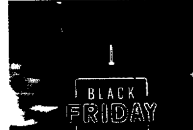
De acordo com a pesquisa, 17% dos entrevistados disseram que pretendem gastar até R$ 50

Os produtos de alimentação e eletrônicos são os mais desejados pelos entrevistados, citados por 18,2%