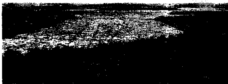
O Brasil estará no centro dos debates referentes à preservação do meio ambiente e mudança do clima

O ministro Fernando Haddad (Fazenda) disse nesta quarta-feira (6) que o conjunto de medidas de corte de gastos deve ter uma decisão final do presidente Luiz Inácio Lula da Silva (PT) nesta quinta-feira (7). Segundo ele, restam "dois detalhes" que precisam ser alvo de uma "arbitragem simples" do chefe do Executivo.