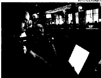
O setor de serviços, um dos mais impactados pela pandemia, liderou a abertura de novas vagas em 2021, com criação de 1,2 milhão de postos

O Brasil gerou 2,7 milhões de vagas de empregos formais ao longo de 2021. Os dados são do Cadastro Geral de Empregados e Desempregados (Caged), divulgados pelo Ministério do Trabalho e Previdência nessa segunda-feira (31). O saldo decorre de 20,6 milhões de admissões e 17,9 milhões de desligamentos, de acordo com a pasta. O saldo de 2021 mostra uma reversão em relação ao ano anterior, quando o resultado líquido foi de 191,5 mil desligamentos (considerando resultados atualizados pela pasta). Naquele ano, o país enfrentava um momento mais severo na economia devido à chegada da Covid-19 e às consequências medidas de distanciamento social.