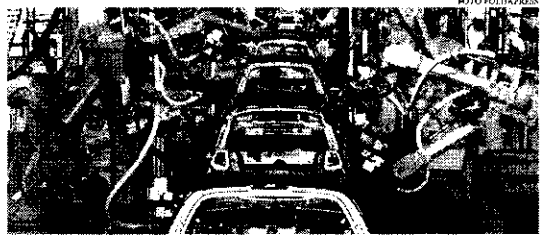
Um total de 126,5 mil veículos foram vendidos no Brasil em janeiro, 26,1% a menos do que no primeiro mês de 2021

Por isso, de acordo com a Anfavea, o setor iniciou 2022 com mais veículos em estoque, porém as vendas de janeiro foram as mais baixas para o mês em 17 anos. Para 2022, a expectativa a Anfavea é que ocorra aumento de 8,5% da quantidade de ve-