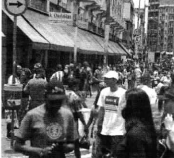
Relatório destaca a necessidade de ampliar e redistribuir a liquidez desde os países desenvolvidos até os países em desenvolvimento

Para 2022, a Cepal projeta uma taxa de desocupação de 11,5% para as mulheres, um pouco inferior aos 11,8% registrados em 2021, mas ainda muito superior aos 9,5% existentes antes da pandemia em 2019. Já para os homens, a desocupação seria de 8,0% este ano, quase igual à de 2021 (8,1%), mas ainda bem acima dos 6,8% registrados em 2019.