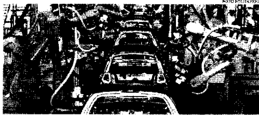
Um total de 126,5 mil veículos foram vendidos no Brasil em janeiro, 26,1% a menos do que no primeiro mês de 2021

Isso ocorreu, segundo a Associação, porque as montadoras tiveram que acelerar o trabalho em dezembro para finalizar automóveis cuja produção não seria mais permitida neste ano, em razão do novo limite de produção veicular aceito no País. Por isso, o processo de fim de ano foi adiado nas fábricas, o que levou à parada de parte considerável do parque industrial automobilístico durante a primeira quinzena do mês. Por isso, de acordo com a Anfavea, o setor iniciou 2022 com mais veículos em estoque, porém as vendas de janeiro foram as mais baixas para o mês em 17 anos. Para 2022, a expectativa a Anfavea é que ocorra aumento de 8,5% da quantidade de veí-