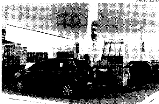
Governo discute com Congresso possibilidade de segurar temporaneamente os reajustes de preços da Petrobras para evitar novo aumento

O conflito no leste europeu entre Rússia e Ucrânia pode intensificar um problema antigo para os brasileiros: o preço do combustível, provocado pela aceleração da alta da cotação do petróleo no mercado internacional. A preocupação atual do governo é agir rapidamente para impedir o impacto da alta dos derivados de petróleo no bolso dos consumidores brasileiros em pleno ano eleitoral, além da alta da inflação que virá desse custo extra. Isso ocorre em razão da paridade internacional do valor do petróleo para reajustar os combustíveis no mercado interno. O Ministério das Minas e Energia (MME) avalia que mexer nessa regra agora prejudicaria o governo e a reeleição do presidente Jair Bolsonaro. O grupo quer a abolição do subsídio para segurar o preço. Há quase dois meses a Petrobras não reajusta o preço dos combustíveis. A defasagem é de 26% para gasolina e de 30% para o diesel em relação ao preço internacional. No último dia 6, o barril de petróleo Brent chegou perto dos US$ 140 (R$ 708), próximo do recorde de US$ 147,50 (R$ 746) de julho de 2008. Na sexta segunda-feira (7/3), o valor chegou, levando em US$ 123,89 (R$ 626,54), mas o cenário de instabilidade torna o preço incerto e, nessa terça-feira (8/3), aumentou 4,77%, sendo negociado a US$ 129,09. O preço deve ser impactado pela decisão do presidente dos Estados Unidos (EUA), Joe Biden, que anun-