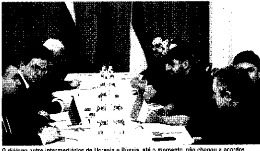
O diálogo entre intermediários de Ucrânia e Rússia, até o momento, não chegou a acordos