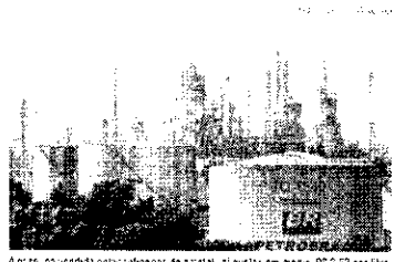
A queda na venda de petróleo no Brasil e a redução das alíquotas de ICMS sobre combustíveis e energia elétrica devem gerar uma redução de 4,8% no preço médio nacional da gasolina em setembro. O repasse deve ser de R$ 0,13 por litro no preço final.

Segundo o presidente da Agência Nacional de Energia Elétrica (ANEEL), o corte das alíquotas de ICMS sobre combustíveis e energia elétrica deve gerar uma redução de 4,8% no preço médio nacional da gasolina em setembro. O repasse deve ser de R$ 0,13 por litro no preço final.