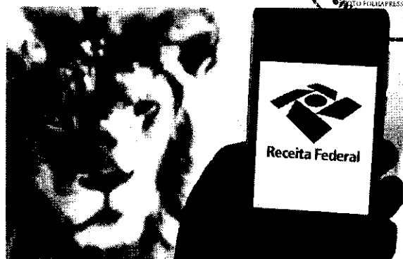
Nos primeiros quatro meses, a arrecadação alcançou R$ 743,2 bilhões, o que representa avanço de 11,05% pelo IPCA