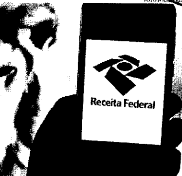
Nos primeiros quatro meses, a arrecadação alcançou R$ 743,2 bilhões, o que representa avanço de 11,05% pelo IPCA

7,69%, a arrecadação da Receita Previdenciária ficou em R$ 42,6 bilhões.