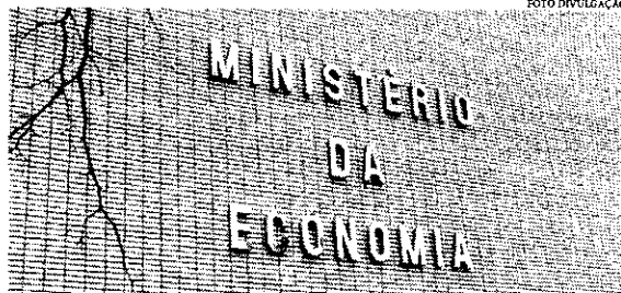
Ministério da Economia diz que a reserva para servidores está sendo usada para diminuir a necessidade total de bloqueio

O bloqueio dos recursos para os reajustes é feito em um momento decisivo sobre o assunto. O governo tem cerca de um mês para dar algum aumento para os funcionários públicos, graças à limitação imposta pela Lei de Responsabilidade Fiscal (que impede elevação de gasto com pessoal nos últimos 180 dias do mandato). O presidente Jair Bolsonaro (PL) sinalizou que poderia dar aumentos privilegiados para políticos, o que gerou uma onda de mobilizações de servidores federais por reajustes. Após muitas idas e vindas, Bolsonaro sinalizou recentemente que poderia conceder aumentos extras para os profissionais da segurança. O ministro Paulo Guedes (Economia) disse publicamente que o único reajuste possível