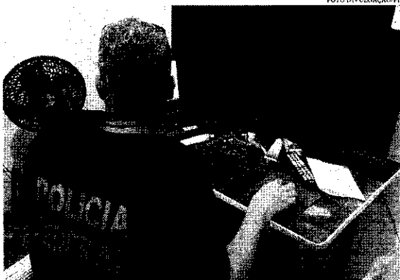
Atualmente, no Ceará, há 50 investigações que podem resultar em operações ou não

Por conta do relatório NC-MEC, em agosto, a PF também cumpriu mandado de busca e apreensão na casa de outro suspeito em Caririaguá.