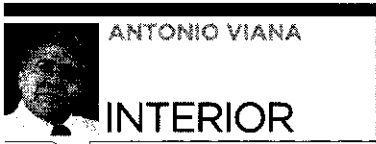
ANTONIO VIANA INTERIOR