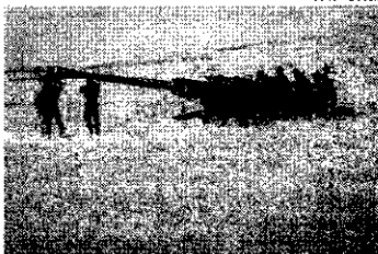
Texto sugere que países da Otan possam fazer pactos para entrar em guerra em caso de invasão russa

O governo da Ucrânia publicou nesta terça-feira (13) um plano de garantias de segurança que prevê que a ajuda militar do Ocidente ao país se amplie e seja estendida por décadas. O texto sugere que países da Otan (grupo militar liderado pelos EUA) possam fazer pactos bilaterais para entrar em guerra em caso de invasão russa na prática retomando a política de alianças continentais que engendraram a Primeira Guerra Mundial e marcaram a Guerra Fria.