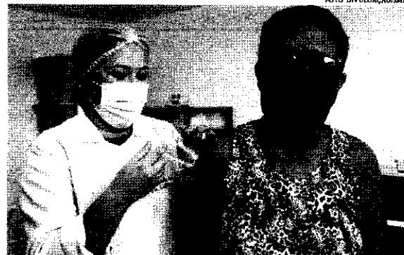
A febre amarela é uma doença com taxa de mortalidade entre 20% e 50%.

exemplifica que, se uma pessoa se contaminar em uma região endêmica e retornar para um local onde exista um vetor como o aedes aegypti, ela pode tornar-se um reservatório potencial para que haja disseminação da febre amarela. De acordo com o Plano de Contingência para Respostas às Emergências em Saúde Pública, do Ministério da Saúde, nos últimos 20 anos, o único estado do Nordeste que registrou a doença foi a Bahia.