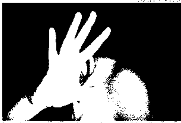
Para o professor, a cultura do silêncio pode ser uma razão para a continuidade da violência doméstica

Desde o início da pandemia de Covid-19, a violência doméstica aumentou em todo o Brasil. No Ceará, mais de 2 mil pessoas foram presas por crimes domésticos em 2022. Segundo pesquisadores, a violência doméstica aumentou durante a pandemia e ainda não conseguiu voltar aos níveis anteriores.