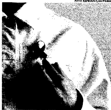
O processo e o estigma acerca do HIV atrapalham e atrasam diagnósticos e tratamentos

O último boletim epidemiológico emitido pela Secretaria de Saúde do Estado (SESA) aponta que, desde 2013, foram diagnosticados 15.698 novos casos de HIV e 9.806 de aids no Ceará. O documento informa que, desde o referido ano, é possível observar um declínio na taxa de detecção de aids, dados que coincidem com a implementação do "tratamento para todos",