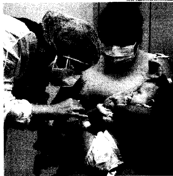
A vacinação de 6 meses a 2 anos começou a ser realizada na capital no dia 19 de novembro

De acordo com o infectologista do Hospital São José e vice-presidente da Sociedade Cearense de Infectologia, Dr. Lauro Perdigão, as vacinas estimulam a defesa do corpo contra microrganismos ca-