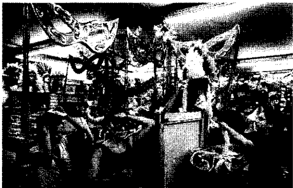
Carnaval de 2023 deve gerar novos postos de trabalho em diversos segmentos do mercado, principalmente o turismo