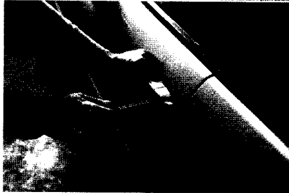
Houve o aumento de 25% no número de furtos no Ceará em comparação com 2021

A Secretaria de Segurança Pública e Defesa Social (SSPDS) informou ao Jornal O Estado que o Ceará apresentou uma retração de 4,6% no número de crimes violentos contra o patrimônio (CVPs) entre janeiro e dezembro de 2022. Ao todo, foram registradas 45.930 ocorrências, enquanto no mesmo período do ano anterior, houve 48.141 crimes do tipo. Nesse contexto, a SSPDS destacou que forças de segurança como a Polícia Civil e a Militar do Ceará (PC-CE e PMCE) atuam diuturnamente no combate a crimes contra o patrimônio. Os dados apontam que aproximadamente 34% dos roubos aconteceram durante o período noturno. Em segundo lugar na lista, aparece o período da tarde com cerca de 28% das ocorrências.