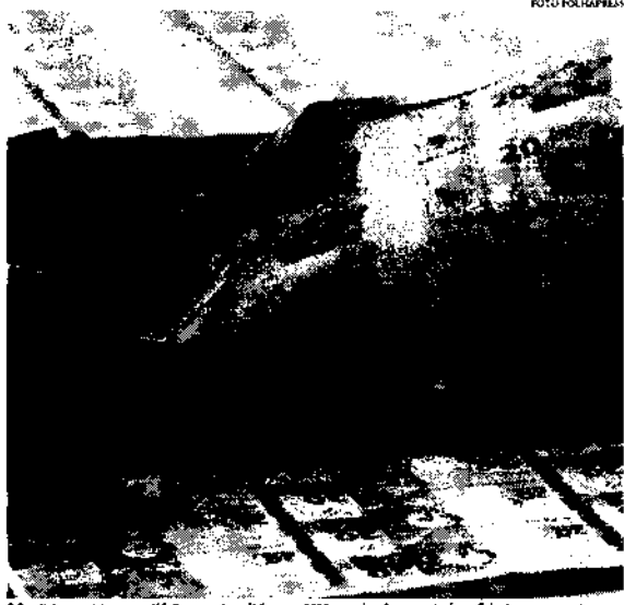
O Brasil deve registrar novo déficit nas contas públicas em 2023, ou seja, não arrecadará o suficiente para pagar despesas

O crescimento nominal de até 14,3%, após avanço de 6% em 2022, é esperado em um momento em que a taxa básica de juros, a Selic, está em 13,75% ao ano. O Brasil deve registrar novo déficit nas contas públicas em 2023. Isso quer dizer que não arrecadará o suficiente para pagar suas despesas e precisará emitir novas dívidas para bancá-las.