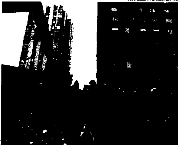
A Organização Mundial de Saúde estima que o terremoto pode afetar até 23 milhões de pessoas

As consequências dos abalos sísmicos se perpetuam em todo o território. As aulas nas escolas, por exemplo, foram suspensas até o dia 13 de fevereiro para que as províncias possam tentar administrar a situação e as unidades escolares possam servir de acomodação para as famílias que necessitarem. Ainda na segunda-feira, já se sabia que o tremor de terra