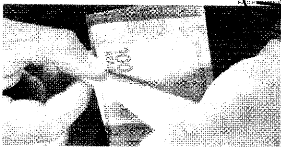
O valor investido será devolvido em 240 prestações mensais que amortizarão o montante aplicado

A avaliação feita pelo ministro Benjamin Zyl-