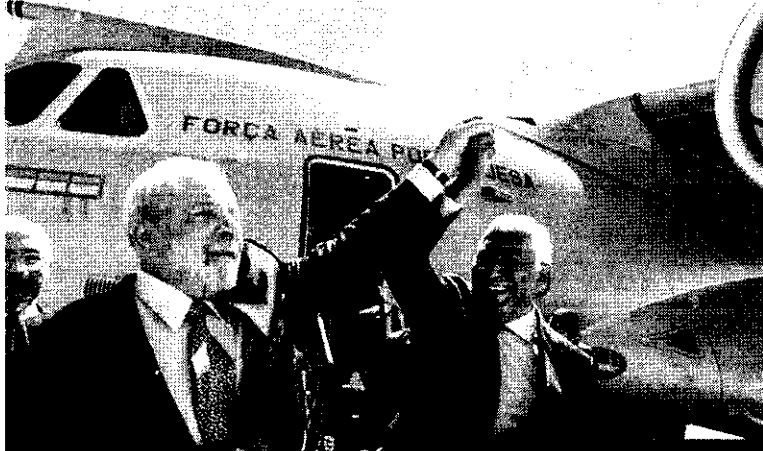
O avião deve ser desenvolvido para atender necessidades dos países da Otan, aliança que Portugal integra

Desde a semana passada, a polícia do Quênia começou a encontrar dezenas de corpos de seguidores de um culto que forçava os fiéis a jejuarem até morrerem para que pudessem alcançar Jesus. De acordo com a polícia do país, até o momento, o número de mortos já chegou a, pelo menos, 73. Uma vala com restos mortais foi encontrada na floresta de Shakhaha, no condado de Kilifi, no leste do país africano. Especial-se que os fiéis integravam a 'Igreja Internacional Boa Nova', em tradução livre, que defende a ideia que, ao morrer de fome, os seguidores encontram o caminho para o céu. O fundador, Paul Mackenzie, é conhecido por incentivar práticas radicais em nome de Je. Há cerca de 10 dias, ele chegou a ser preso pelas autoridades, porém, negou qualquer envolvimento com o caso. O chefe das investigações, Charles Koinau, afirmou aos jornalistas que os agentes seguem em busca de desaparecidos. Além disso, os investigadores acreditam que boa parte do grupo segue escondido na mata, jejuando,