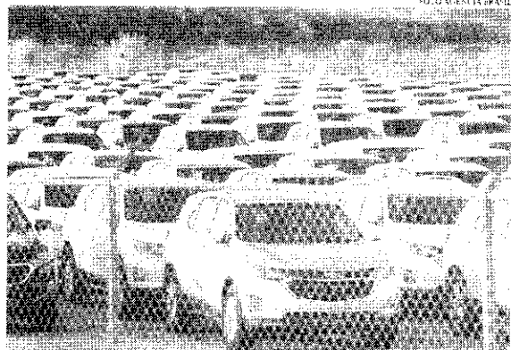
O governo federal afirma que a redução nos preços pode atingir 33 modelos, de 11 marcas

Serão contemplados veículos cujos preços sejam de até R$ 120 mil. Acima desse valor, não terão descontos, de acordo com o vice-presidente. Hoje, o automóvel mais barato vendido no Brasil é o Renault Kwid na versão Zen, que custa R$ 69 mil. "Acima de R$ 120 mil,