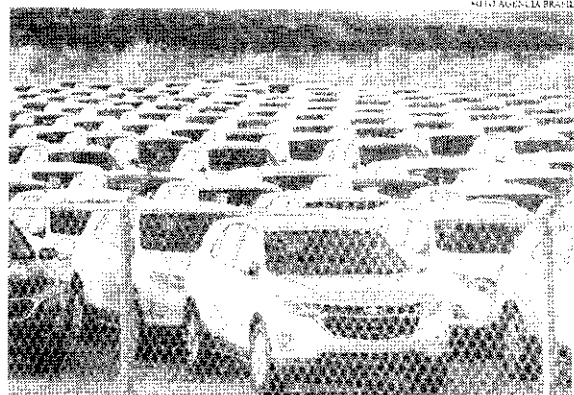
O governo federal afirma que a redução nos preços pode atingir 33 modelos, de 11 marcas

Serão contemplados veículos cujos custos sejam de até R$ 120 mil. Acima desse valor, não terão descontos, de acordo com o vice-presidente. Hoje, o automóvel mais barato vendido no Brasil é o Renault Kwid na versão Zen, que custa R$ 69 mil. "Acima de R$ 120 mil