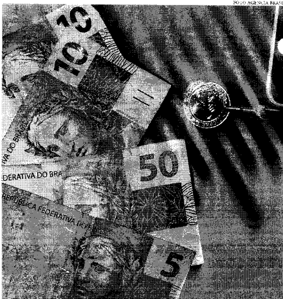
Em 2022, primeiro ano de vigência da regra, o governo adiou R$ 21,9 bilhões em dívidas judiciais

PEC dos Precatórios A PEC dos Precatórios foi aprovada em 2021 como uma alternativa do governo de Jair Bolsonaro para conseguir honrar benefícios previdenciários, irritar emendas parlamentares e ampliar os gastos sociais em 2022, ano eleitoral. Uma das medidas centrais da proposta era o parcelamento dos precatórios, viabilizado por meio da criação de um limite anual para o pagamento desses débitos, válido até 2026. O valor excedente seria pos-