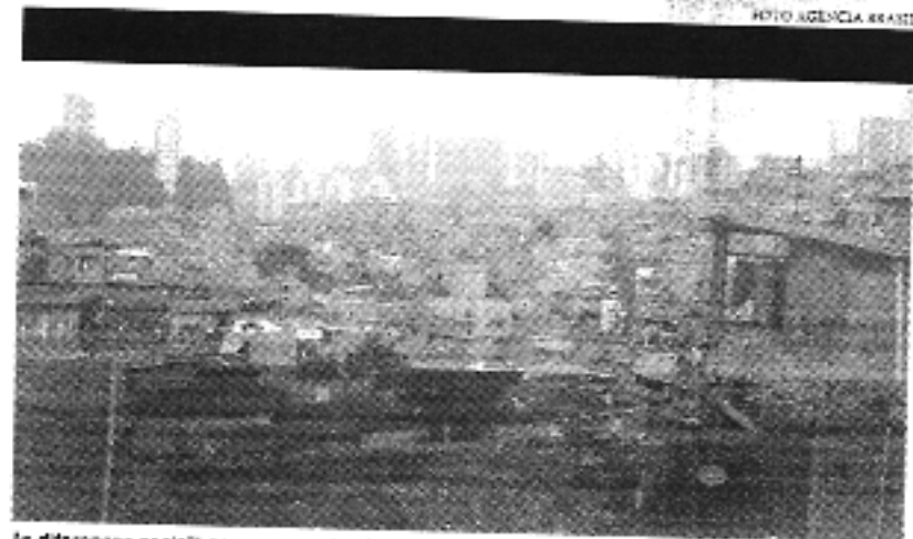
As diferenças sociais seguem acentuadas no país, mas a diferença também é a menor

O rendimento domiciliar per capita da metade da população mais pobre por exemplo, sobu 18% no ano passado, chegando a R$ 537 por mês. Enquanto isso, o ganho médio dos brasileiros 1% mais ricos foi de R$ 17.447. O valor ficou 0,3%