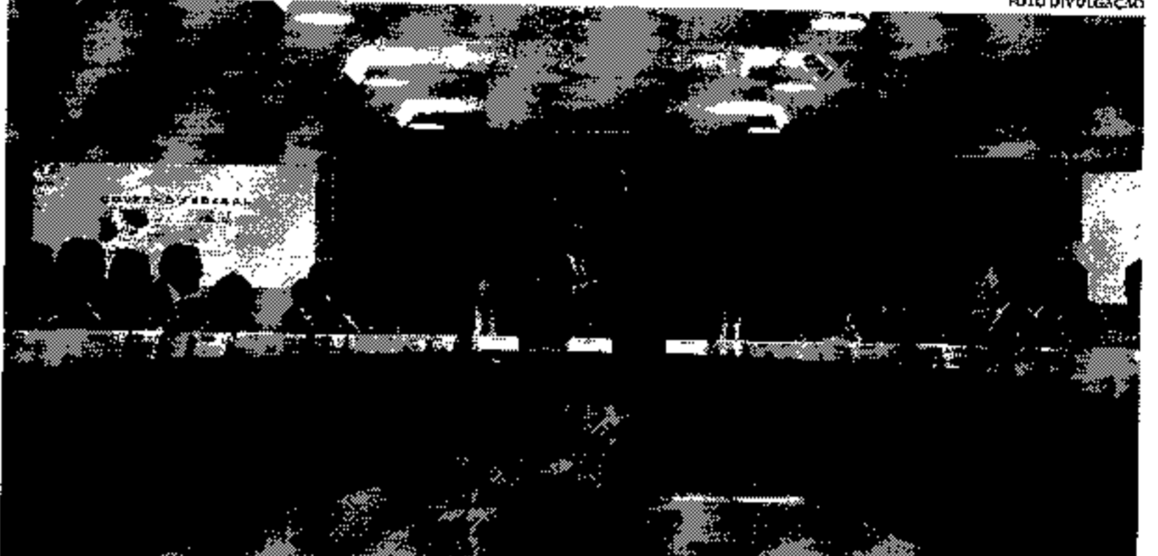
A reunião contou com a participação de 35 dos 37 ministros, com exceção de Marina Silva (Meio Ambiente), em tratamento de saúde, e Luiz Marinho (Trabalho), em viagem internacional

O celular do ex-ajudante de ordens de Jair Bolsonaro (PL), tenente-coronel Mauro Cid, tinha mensagens e documentos que revelam uma trama para dar um golpe de estado, afastar ministros do Supremo Tribunal Federal (STF) e colocar o país sob intervenção militar.