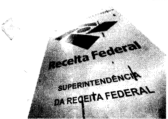
Se firmada, a proposta deve aumentar o número de isentos, passando dos atuais 8.944.261 para 10.294.779, avanço de 15%

A atualização da tabela do IR havia sido uma das promessas de campanha do ex-presidente Jair Bolsonaro que não se consolidou. Da mesma forma, o atual presidente, Luiz Inácio Lula da Silva, também prometeu a medida. Após eleito, Lula defendeu a isenção do IR para quem ganha até R$ 5