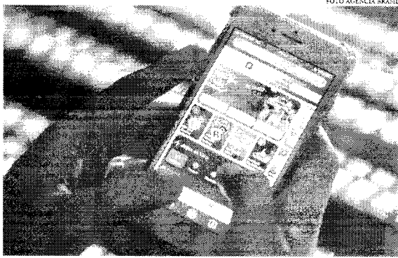
As apostas esportivas já são legalizadas, mas carecem de regulamentação adequada

A taxa das apostas também destinará recursos para diversas áreas. Os valores arrecadados serão direcionados para segurança pública, educação básica, clubes