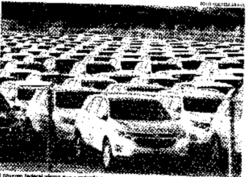
O governo federal afirma que a redução nos preços pode atingir 33 modelos, de 11 marcas

Serão contemplados veículos cujos preços sejam de até R$ 230 mil. Acima desse valor, não terão descontos, de acordo com o vice-presidente. Hoje, o automóvel mais barato vendido no Brasil é o Renault Kwid na versão Zero, que custa R$ 69 mil. "Acima de R$ 120 mil