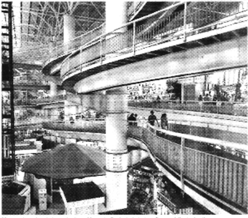
Mesmo durante a baixa estação, o Mercado Central ainda tem fluxo médio de 4 mil pessoas

Na sexta-feira, Sarto garantiu ainda que não haverá necessidade de interromper as atividades no local, uma vez que a reforma acontecerá por etapas. "O Mercado tem 520 empreendedores. Aqui tem um fluxo de seis mil pessoas na alta estação