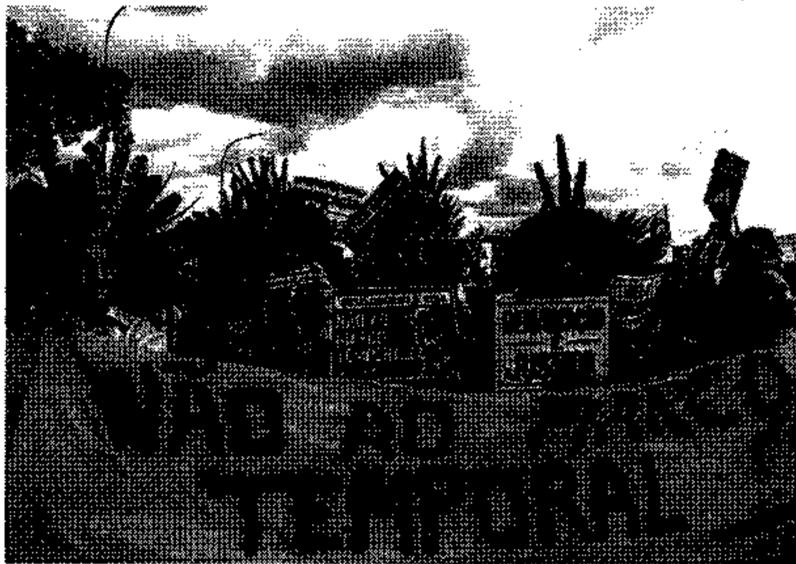
Tese é criticada por advogados especializados em direitos dos povos indígenas

Pela ordem de votação do Supremo, o ministro que deveria iniciar a sessão hoje seria Luiz Fux, mas Toffoli pediu para antecipar o voto. "Estamos a julgar a pacificação de uma situação histórica. Não estamos a julgar situações concretas, estamos