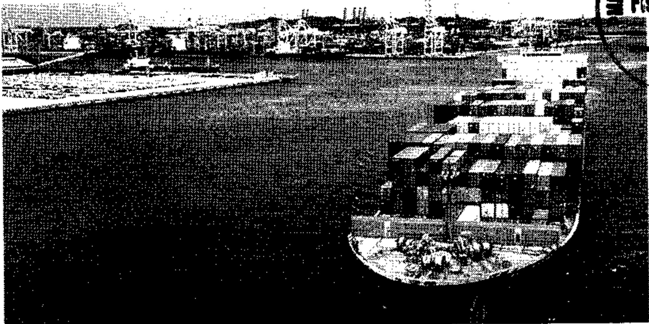
Só em grãos, o Brasil exportou diretamente 193,02 milhões de toneladas montando 24,3% superior se comparado com os 155,30 milhões de toneladas exportadas em 2022

sua área de competência, o Banco Central rotineiramente avalia a adequação normativa das práticas comerciais, em particular aquelas baseadas no parcelado sem juros, adotadas pelas instituições reguladas", disse em nota a autoridade monetária. Ainda segundo o BC, a instituição "não opina acerca de instituições específicas". A Senacon pediu que as empresas apresentem, em dez dias, um relatório detalhando, entre outras informações, como é realizada a cobrança de tarifas e juros, se as tarifas cobradas possuem fundamentação legal, se os consumidores são avisados previamente e se houve restituição de tarifas ou juros. Após o envio do relatório pelas empresas e da análise pela secretaria, existe ainda a possibilidade de que a Senacon determine a suspensão do suposto parcelado sem juros pirata, sob pena de multa diária de R$ 5.000 em caso de descumprimento das exigências. O órgão afirmou que pode também instaurar um processo administrativo. "A medida cautelar da Senacon visa proteger os consumidores e garantir a transparência nas operações financeiras. A Senacon atuou com atenção ao caso, observando os prejuízos aos consumidores, mas também consciente do direito à ampla defesa das empresas", afirmou o secretário Nacional do Consumidor, Wadid Damous, em nota.