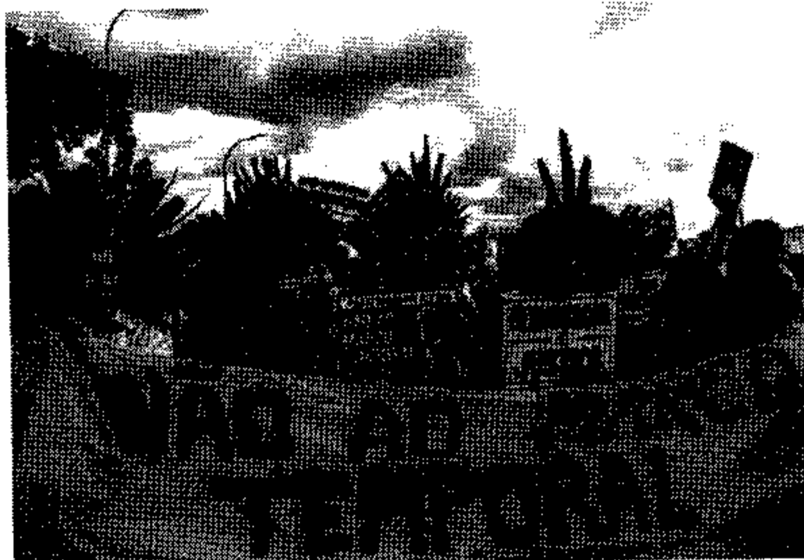
Tese é criticada por advogados especializados em direitos dos povos indígenas

Pela ordem de votação do Supremo, o ministro que deveria iniciar a sessão hoje seria Luiz Fux, mas Toffoli pediu para antecipar o voto. "Estamos a julgar a pacificação de uma situação histórica. Não estamos a julgar situações concretas, estamos