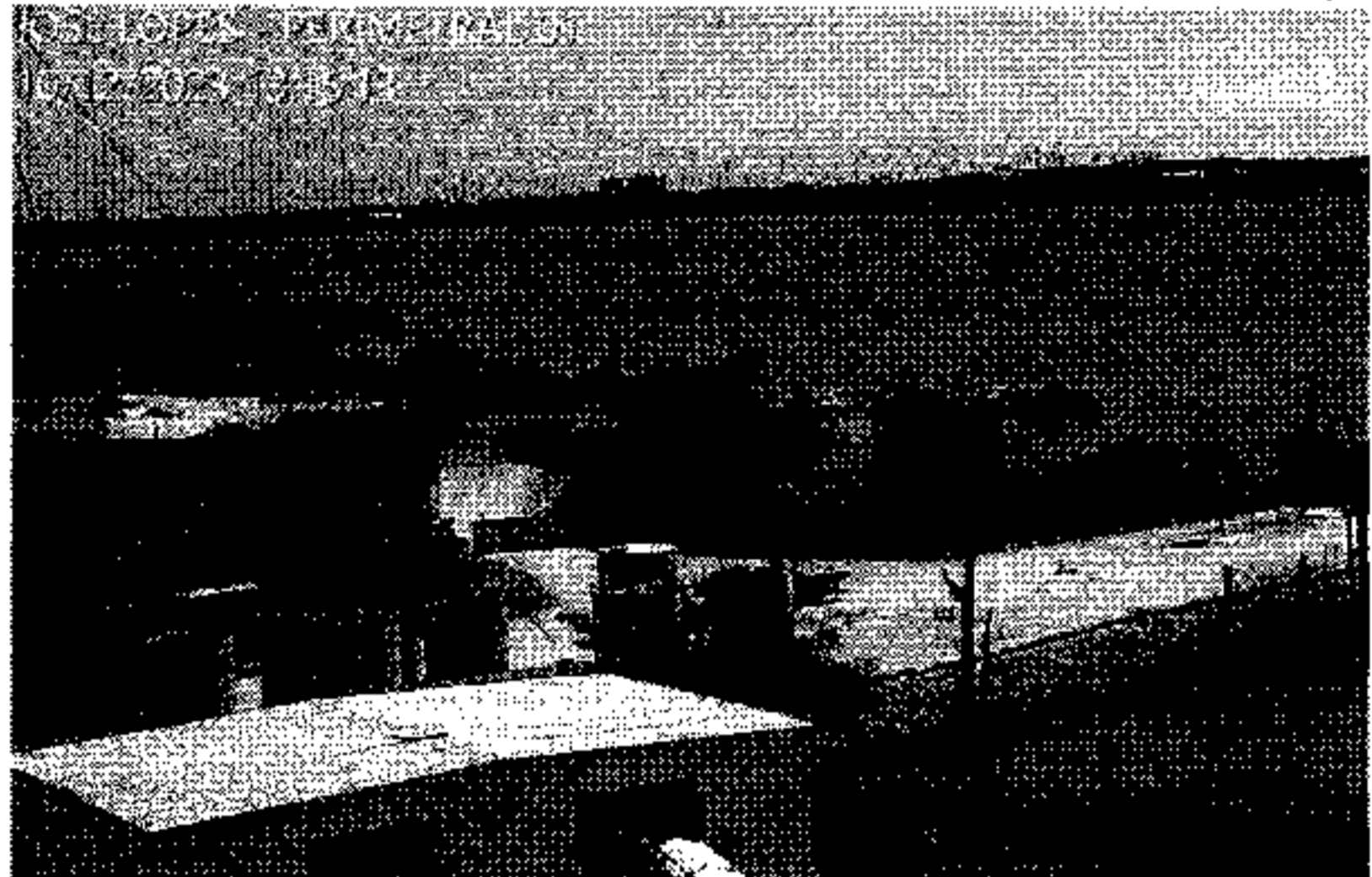
A área do rompimento está localizada sob a lagoa Mundaú. Com isso, a água deve ficar altamente salinizada

Na imagem divulgada pelo prefeito mostra o momento em que o rompimento ocorreu, causando grande movimentação no espelho d'água da lagoa. "A Defesa Civil de Maceió ressalta que a mina e todo o seu entorno estão desocupados e não há qualquer risco para as pessoas", disse ele, em uma rede social. Por meio de nota, a multinacional Braskem afirmou que câmeras monitoram o entorno da cavidade 18 registraram às 13h15 movimento atípico de água na lagoa, no trecho sobre esta cavidade. Movimento semelhante ocorreu por volta das 13h45. "O sistema de monitoramento de solo captou a movimentação por meio de DGPS [aparelhos de alta precisão para detectar movi-