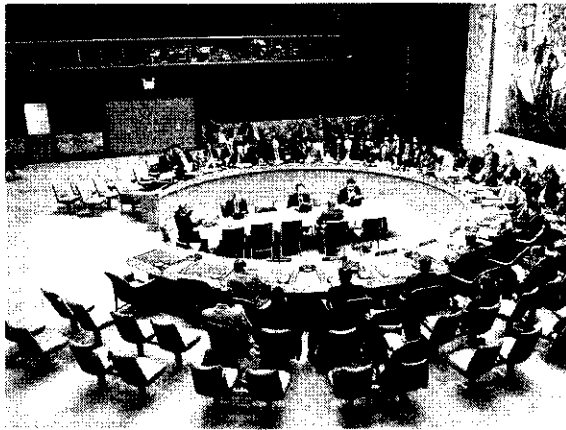
O Conselho de Segurança é um dos órgãos mais importantes da ONU e visa a manutenção da paz

Nesse domingo, 21, o Brasil assumirá a presidência do Conselho de Segurança da ONU. O país ocupará o cargo por um mês, até o dia 20 de novembro. Durante esse período, o Brasil terá o direito de veto nas decisões do Conselho de Segurança da ONU. O Brasil também terá o direito de veto nas decisões do Conselho de Segurança da ONU. O Brasil também terá o direito de veto nas decisões do Conselho de Segurança da ONU.