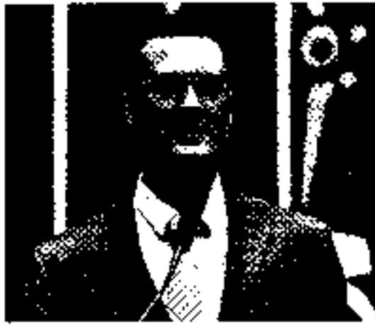
A base da acusação lesa a Lei da Ficha Limpas, que prevê a inelegibilidade de membros do MP que pediram "exoneração ou pensão de processo administrativo disciplinar".

A base da acusação foi a Lei da Ficha Limpas, que prevê a inelegibilidade de membros do MP que pediram exoneração ou aposentadoria voluntária ou pensão de processo administrativo disciplinar. Se configurada, a inelegibilidade