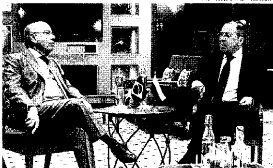
O Kremlin disse que regularmente há reuniões entre os ministros das Relações Exteriores dos dois países

Em 3 de outubro de 1828, Piotr Kotli, se tornou o primeiro enviado russo para o Brasil. No dia em sua postagem, o