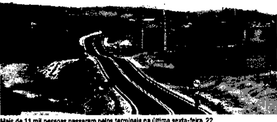
Mais de 11 mil pessoas passaram pelos terminais na última sexta-feira, 22

Com a chegada dos eventos de fim de ano, as autoridades envolvidas na manutenção da segurança viária tanto da capital quanto do Estado reforçaram as suas presenças nas vias. A Autarquia Municipal de Trânsito e Cidadania (AMC), por exemplo, concentrou esforços em locais de Fortaleza como a Praia de Iracema e a Praia do Futuro no Natal, o que deverá se repetir no próximo fim de semana, em decorrência das celebrações de Réveillon. Um levantamento do órgão, que considerou os sinistros com severidade registrados entre 2018 e 2022, indicou que os meses de novembro e dezembro registraram em média um acréscimo de 10,7% nas mortes nas vias em comparação ao restante do ano.