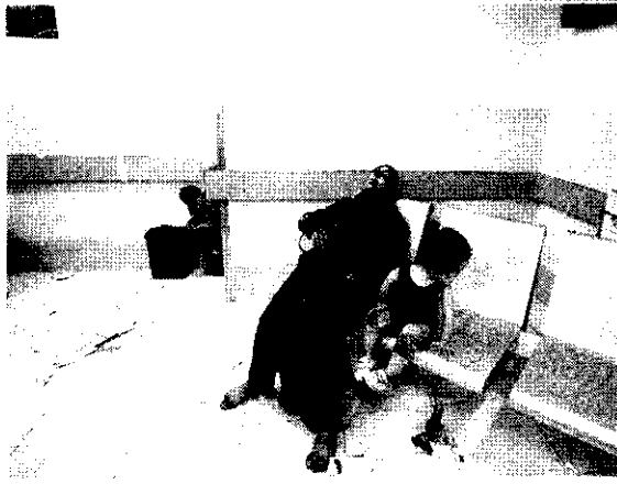
Pacientes feridos recebem atendimento no Hospital Shifa após bombardeio no Hospital Al-Ahli em Gaza

Autoridade Nacional Palestina - o presidente da ANL, Mahmud Abbas, de clarou sua oficial de três dias nos territórios palestinos (a Faixa de Gaza e a Cisjordânia) por conta das mortes no hospital de Gaza bombardeado por Israel. O porta voz de Abbas chamou o ataque de um "genocídio" e uma "catástrofe humanitária".