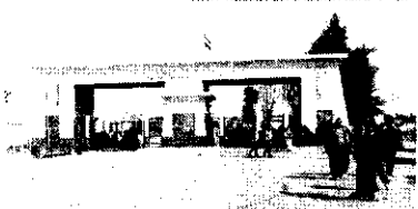
Em todo, aproximadamente 2,8 mil cidadãos receberam autorização para deixar a Faixa de Gaza

Brasileiros não foram incluídos na quinta lista de autorizados a deixar Gaza, enviada pelo governo de Israel. O grupo de 34 pessoas, incluindo brasileiros, que o governo brasileiro vem negociando para ser liberado, não está na lista. Segundo fontes diplomáticas, o Brasil está tentando negociar a liberação de 34 pessoas, incluindo brasileiros, que não foram incluídos na lista. O grupo de 34 pessoas, incluindo brasileiros, que o governo brasileiro vem negociando para ser liberado, não está na lista.