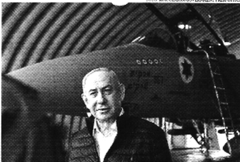
O comunicado foi divulgado pelo gabinete do premiê após uma visita a uma base da força aérea

A fala fez com que o ministro de Relações Exteriores