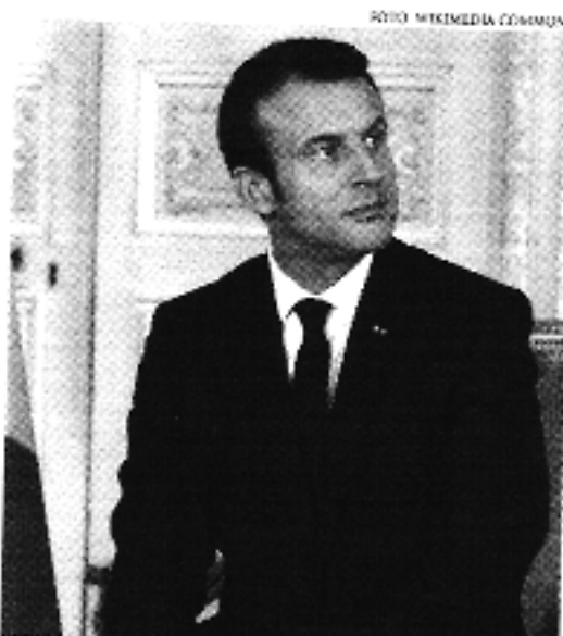
Para Macron, europeus devem dar prioridade à compra de equipamentos militares da Europa

Na visão dele, os europeus devem, inclusive, dar prioridade à compra de equipamentos militares originários da própria Europa. "Temas que produzir mais rápido e temas que produzir como europeus", argumentou. O francês afirmou que há o risco de o continente ser prejudicado economi-